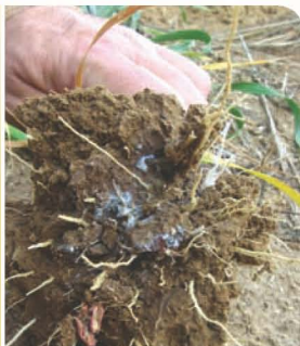
ניסוי מניעת זבוב מיקרופזה בחימצה-זהבית צרעה 2009