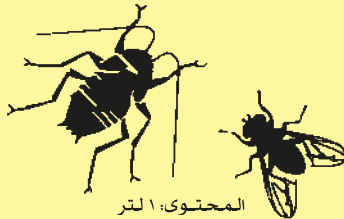
المحتوى: 1 لتر

מستحضر ליאדה الحشرات الزاحفة والطائرة Cyfluthrin (مجموعة: بيرثرونييد Pyrethroid) ب.حوي. 50 غرام/لتر (تركيز للمدة 0.059% V/V) الفئيب الريئسي: كسيليول